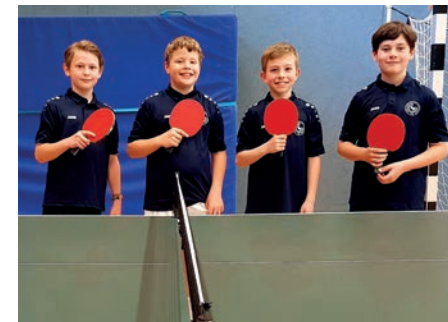
Tabelle der U19

Und als wäre das noch nicht genug, war auch unsere Jugend sehr erfolgreich. OHNE Punktverlust spielte sich die U19 verdient zum Meistertitel und steigt damit ebenfalls auf. Premiere feierte in diesem Jahr unsere U13 in ihrer ersten Punktspielsaison und konnte diese direkt mit einem starken 4. Platz beenden!