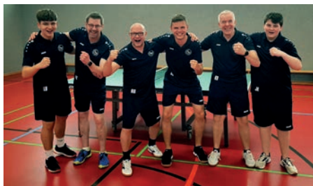
1. Herren nach dem Aufstieg

Für die Tischtennis-Mannschaften unseres Vereins gab es am Ende der Saison einiges zu feiern. So holte unsere 1. Herrenmannschaft in der Kreisliga Mitte den Meistertitel und steigt zur nächsten Saison in die 2. Bezirksklasse auf! Der Jubel nach dem finalen Spiel war entsprechend groß!